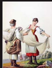
(2) Plátenník, kolorovaná rytina podľa kresby J. H. Bikessyho, 1816