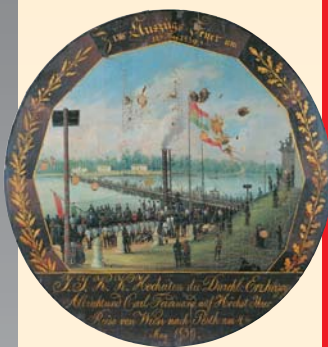
(9) Strelecký terč: Vítanie parníka na Dunaji, maľba na drevo, 1839. Mestské múzeum Bratislava. Prvý parník priplával do Bratislavy v roku 1818