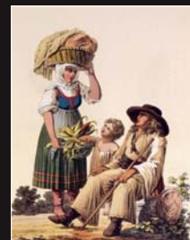
(3) Slovenská rodina z okolia Čadce a Žaliny, kolorovaná rytina podľa kresby J. H. Bikessyho, 1816