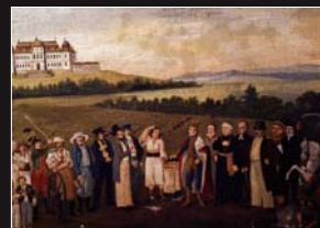
(4) To vás mám všetkých živiť? - pyta sa poddary roľník na obraze od neznámeho autora, olej, 1. polovica 19. storočia. SNM - Historické múzeum Bratislava