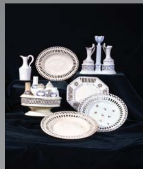
(8) Súprava nádob z kameniny vyrobená v manufakture v Košiciach, 1. polovica 19. storočia. SNM - Historické múzeum Bratislava