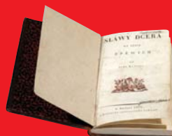
(11) V roku 1824 vydal Ján Kollár básnickú skladbu Slávy dcéra, ktorá sa stala literárnou udalosťou v slovanskom svete