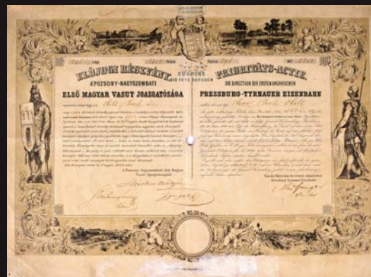
(15) Účastina prvej kónskej železnice Bratislava - Trnava, 1846