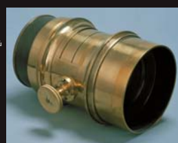
(16) Jozef Maximilián Petzval (1807 - 1891), rodák zo Spišskej Belej, vypočítal v roku 1840 parametre zokonaleného fotografického objektívu, ktorý znamenal revolučnú zmenu vo fotografovaní. Objektív typu Petzval, 60. roky 19. storočia. Slovenské technické múzeum Košice