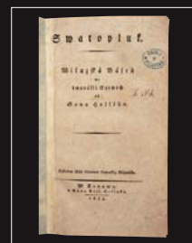
(14) Ján Hollý (1785 - 1849), najvýznamnejší bernolákovský básnik vydal v roku 1833 hrdinský epos Svätopluk, v ktorom stvárnil dejiny Slovákov v období Veľkej Moravy