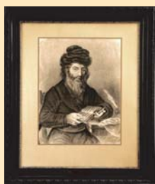
(6) V rokoch 1806 - 1839 pôsobil v Bratislave významný rabin Chatam Sofer