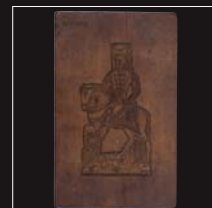
(5) Forma na medovníky, drevo, 1. polovica 19. storočia. SNM - Historické múzeum Bratislava