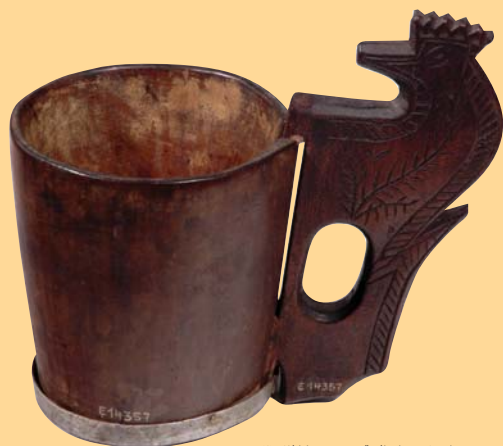
(1) Nádobu na pitie - črpák, drevo, 1. polovica 19. storočia. Črpká vyrábali pastieri oviec v horských oblastiach. SNM - Historické múzeum Bratislava

Prvá polovica 19. storočia priniesla aj na Slovensko závan priemyselnej revolúcie. Jej postup v podmienkach feudálnych vzťahov bol však pomalší ako v krajinách západnej Európy. Popri tradičnom ťažbe a spracovaní vzácnych kovov sa rozvíjalo najmä železiarstvo, súkenníctvo, výroba keramiky, sklárstvo, papieriectvo, cukrovárňctvo, vznikli prvé podniky strojárstva. Nespokojnosť s feudálnymi pomermi na vidieku sa prejavila krvavým povstaním roľníkov na východnom Slovensku v roku 1831. V dvadsiatych rokoch vstúpila na scénu nová generácia národných buditeľov. Aktivitu prevzal evanjelický prúd, ktorý kladol dôraz na myšlienku spolupatričnosti všetkých slovanských národov. Významnú úlohu v národnom hnutí zohrávali študentské samovzdelávacie spolky na evanjelických lýceách v Bratislave, Kežmarku, Levoči, Banskej Štiavnici, Prešove a Žoproni a spolky evanjelických vzdelancov v Pešti a vo Viedni. Snahy o spoluprácu jazykovo rozdelených slovanských vzdelancov evanjelikov a katolíkov, vyústili v roku 1844 do založenia spoločného spolku Tatrin. Slovenské národné hnutie v 1. polovici 19. storočia podstatne rozšírilo svoju základňu a formy činnosti, jeho aktivity sa prejavovali vo viac ako sto strediskách národného života.