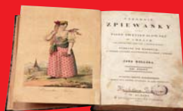
(12) Významným prejavom a súčasťou národnej kultúry Slovákov boli ľudové piesne. Zbierateľ ich a v rokoch 1834 - 1835 vydal Ján Kollár