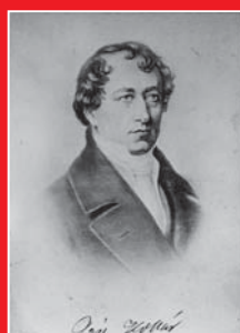
(10) Ján Kollár (1793 - 1852) evanjelický kňaz a spisovateľ, popredný dejateľ národného obrozenia, dobový portrét