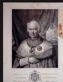
(13) Alexander Rudnay, zakladateľ baziliky v Ostrihomu, sa ako prvý Slovak stal v roku 1819 arcibiskupom a primasom katolíckej cirkvi v Uhorsku, dobová litografia