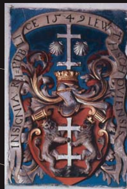
(2) Erb mesta Levoča nad portálom radnice, 1549