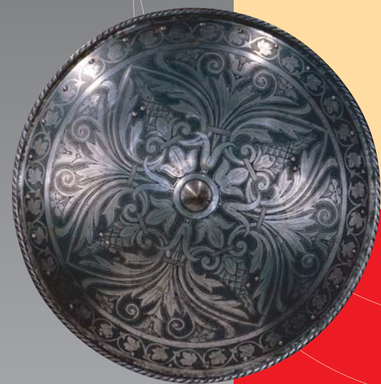
(8) Renesančný štít, 17. storočie. SNM - Historické múzeum Bratislava