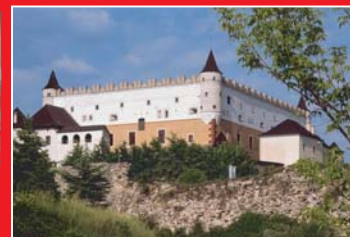
(13) Renesančne upravený zámok vo Zvolene