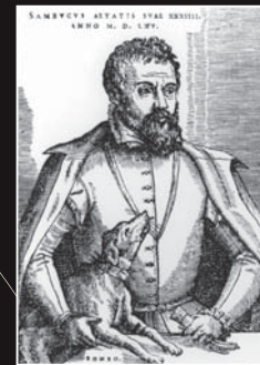
(3) Humanistický učenec a spisovateľ Ján Sambucus (1531 - 1584). Narodil sa v Trnave, študoval na univerzitách vo Viedni, Lipsku, Wittenbergu, Ingolštade, Štrasburgu, Paríži, Padove a Bologni. Stal sa cisárskym historiografom vo Viedni. Bol významným vydavateľom antických diel. Dobová rytina