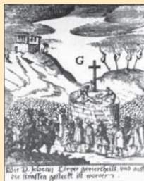
(5) Poprava Jána Jessenia na Staromestskom námestí v Prahe, dobová rytina