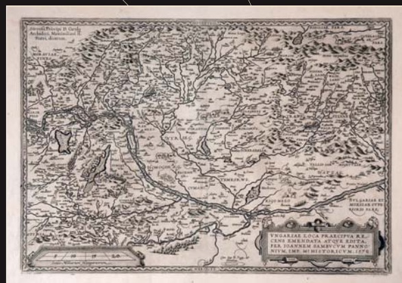
(6) Mapa Uhorska od Jána Sambucusa, 1579. Archív mesta Bratislava