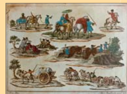
(10) Grafický vzorkovník, 17. storočie. SNM - Historické múzeum Bratislava