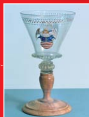
(11) Pokál s mestským znakom Bardejova, 16. storočie. Šarišské múzeum Bardejov