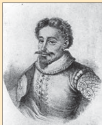
(4) Ján Jessenius (1566 - 1621), lekár, humanistický učenec a politik. Narodil sa vo Wroclavi, študoval vo Wittenbergu, Lipsku a Padove. Pôsobil v Drážďanoch, Wittenbergu, Viedni, Tubingene, Siene. Rektor univerzity v Prahe, kde v roku 1600 uskutočnil prvú verejnú pitvu v Čechách. V roku 1621 ho popravili za účasť na českom stavovskom povstaní