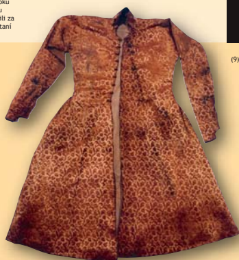
(9) Dolomán - súčasť pohrebnej obliečenia evanjelického palatina Juraja Thurzu, 1616. Oravské múzeum Dolný Kubín