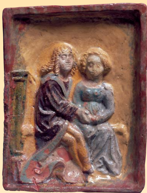
(1) Renesančná kachlica: Sediaci muži a žena, hlina, polychróma glazúra, 16. storočie. Trenčianske múzeum Trenčín

Ideové prúdy novoveku, humanizmus a renesancia, sa na Slovensku prejavovali už od konca 15. storočia. Hlboko a nadsť ovplyvnili sféry myslenia, literatúry, vzdelávania, výtvarného umenia, hudby i materiálnej kultúry. Renesančná architektúra menila tvárnosť miest i šľachtických sídiel. V literatúre a vzdelávaní sa objavil slobodný rozlet myšlienok, nové umelecké formy a využívanie národných jazykov. Vznikli prvé tlačiarne, ktoré napomáhali šíriť znalosti a literárne diela medzi čoraz viac ľudí. Slovenskí humanistickí vzdelanci udržiavali kontakty s vedúcimi osobnosťami svojej doby, mnohí študovali a pôsobili v Nemecku, Francúzsku, Taliansku a ďalších európskych krajinách, mnohí z nich sa hlásili k svojmu slovenskému pôvodu. V renesančnom a s ním spojenom reformačnom myslení sa zrodili prvé výhonky slovenského národného uvedomenia. V písomnom prejave a styku Slováci popri úradnej latinčine čoraz častejšie používali češtinu, spravidla v slovakizovanej podobe. Z obdobia vojen s Tŕkami sa zachovali slovenské historické piesne o hrdinstv protitureckých bojovníkov, ale i útrapách, ktoré priniesla doba.