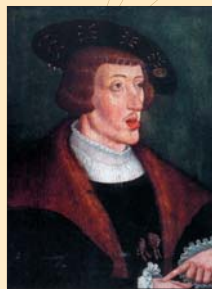
(5) Ferdinand I. Habsburský, uhorský kráľ v rokoch 1526 - 1563, olej, 16. storočie