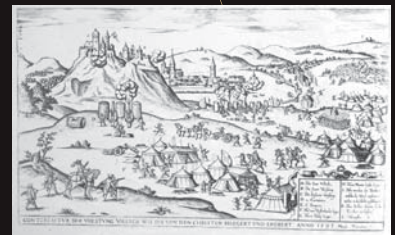
(7) Osmanskí Turci sa zmocnili aj južných okrajových častí Slovenska. Ftakovský hrad, ktorý dobyli v roku 1594 sa stal sídlom ftakovského sandžaku. V roku 1593 ho však cisárske vojská získali späť. Víťazstvo cisárskych vojsk pri Ftakove v roku 1593, lept. J. Limbachera, 1603