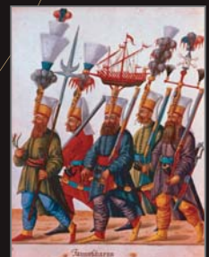
(11) Tureckí vojaci janičari vychovávaní z mladých kresťanských zajatcov