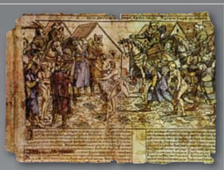
(8) Odvliekanie ľudí do tureckého otroctva, medrytina, 16. storočie