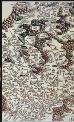
(4) Najstaršia mapa Uhorska, tzv. Tabula Hungarie, vydaná v Ingolštade v roku 1528 (výrez s územím Slovenska)