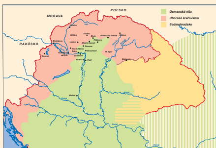
(12) Uhorsko v období osmanskej expanzie (koniec 16. - začiatok 17. storočia)