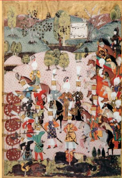
(1) Nástup tureckého vojska v bitke pri Moháči v roku 1526, turecká dobová miniatúra

Význam Slovenska v rámci multietnického Uhorska nebývalé stúpol začiatkom 16. storočia. Stalo sa tak paradoxne v dôsledku expanzie Osmanskej ríše, ktorá po víťazstve v bitke pri Moháči v roku 1526 postupne ovládla južnú a strednú časť územia Uhorska (ležiacu na teritóriu súčasného Maďarska). Na Slovensko boli presunuté centrálné inštitúcie štátu a katolíckej cirkvi. Juh Slovenska sa takmer na jeden a pol storočia stal nekludnou hranicou dvoch svetov, dvoch civilizácií. Neustále boje, lúpeživé nájazdy Turkov, popravy a odvliekanie ľudí do tureckého zajatia - to sú dobové obrázky z vtedajšieho života. Prvé desaťročie po Moháči bolo zároveň naplnené vnútorným zápasom o kráľovskú korunu. Súperenie Ferdinanda I. z rodu Habsburgovcov a sedmohradského vojvodu Jána Zápoľského skončilo v roku 1538 faktickým rozdelením krajiny na tri časti: Uhorské kráľovstvo s hlavným mestom Bratislavou, sedmohradské kniežatstvo a osmanský pašalik so sídlom v Budíne.