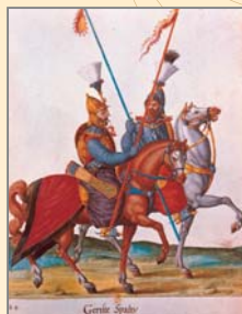
(9) Tureckí žoldnierski jazdci sipáhovia