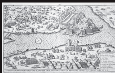
(13) Obliehanie Komárna tureckým vojskom v roku 1594, dobová rytina