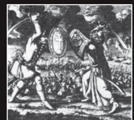
(14) Symbolika bojov kresťanského a moslimského sveta na slovensko-tureckom pomerí, dobová rytina