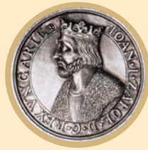
(6) Ján Zápoľský, konkurent Ferdinanda I. v boji o trón, 16. storočie