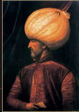
(2) Sultán Sulejman II. (Nefliyi), víťaz bitky pri Moháči, olej, 2. polovica 16. storočia