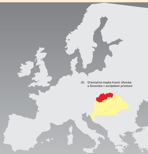
(5) Orientačná mapa hraníc Uhorska a Slovenska v európskom priestore