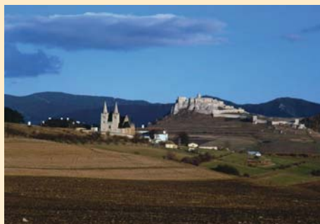
(2) Spišská kapitula a Spišský hrad, svedkovia dávnej histórie Slovenska