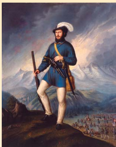
(1) P. M. Bohúň: Janko Francisci ako kapitán slovenských dobrovoľníkov v revolúcii 1848 - 1849, olej, okolo 1850. Slovenská národná galéria Bratislava

* Treba podotknúť, že v slovenčine existuje pre tento multietnický štátny útvar, ktorý zanikol až v roku 1918, osobitné pomenovanie „Uhorsko“ resp. „Uhorské kráľovstvo“. V maďarčine a následne aj v mnohých cudzích jazykoch sa však na jeho označenie používa rovnaký názov ako pre súčasné Maďarsko. V záujme rozlíšenia týchto historicky i teritoriálne rozdielnych štátnych útvarov sme v prekladoch textov výstavy použili pre obdobie do roku 1918 termín „historické Maďarsko“. Okrem Maďarov žili v historickom Maďarsku Slováci, Chorváti, Nemci, Rumuni, Srbi, Rusíni, Poliáci, Židia a ďalšie národnosti.