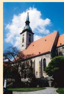
(3) Dóm sv. Martina v Bratislave zo 14. - 15. storočia. V rokoch 1563 - 1830 bol miestom korunovácií uhorských kráľov a kráľovien